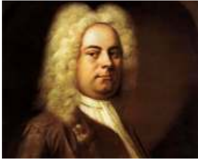
George Friedrich Händel

Cuando todos estos cambios musicales ya estaban plenamente desarrollados, el terreno se encontró preparado para la aparición de los dos gigantes del Barroco Tardío: Johann Sebastian Bach y George Friedrich Haendel , ambos alemanes. Otros compositores a destacar fueron: la francesa el inglés Henry Purcell , los italianos Vivaldi y Barbara Strozzi o los franceses Jean Baptiste Lully (de origen italiano) y Elizabeth Jacquet de la Guerre .