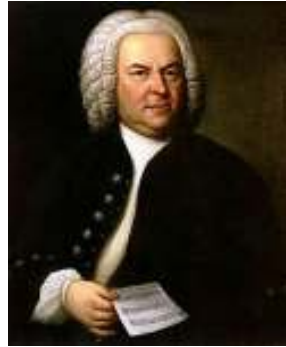
Johann Sebastian Bach