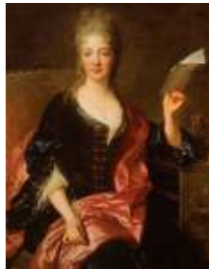
Elizabeth Jacquet de la Guerre