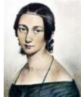
Clara Wieck (Clara Schumann)